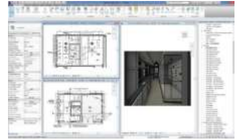
Cree mejores diseños