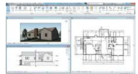
Trabaje con un único modelo coordinado