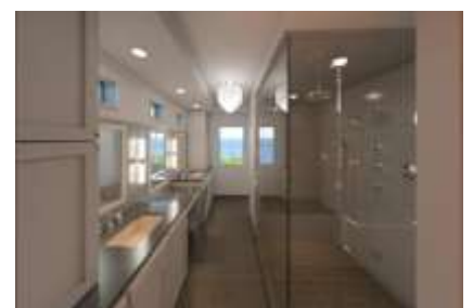
Cree renderizados fotorrealistas